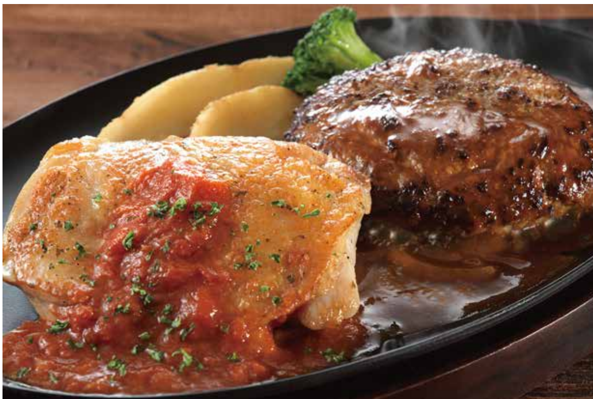
ハンバーグステーキ & チキングリル ————— ¥1,490 パリッとジューシーに焼き上げたチキンを組み合わせた大満足メニュー。 (税込¥1,639)