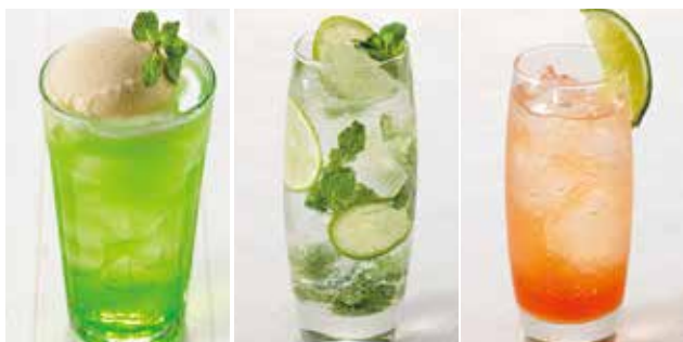
※イラスト、写真はイメージです。

バージンピーチフィズ ¥500 桃の風味が口いっぱい広がる 華やかな香りのソーダです。 (税込¥550)