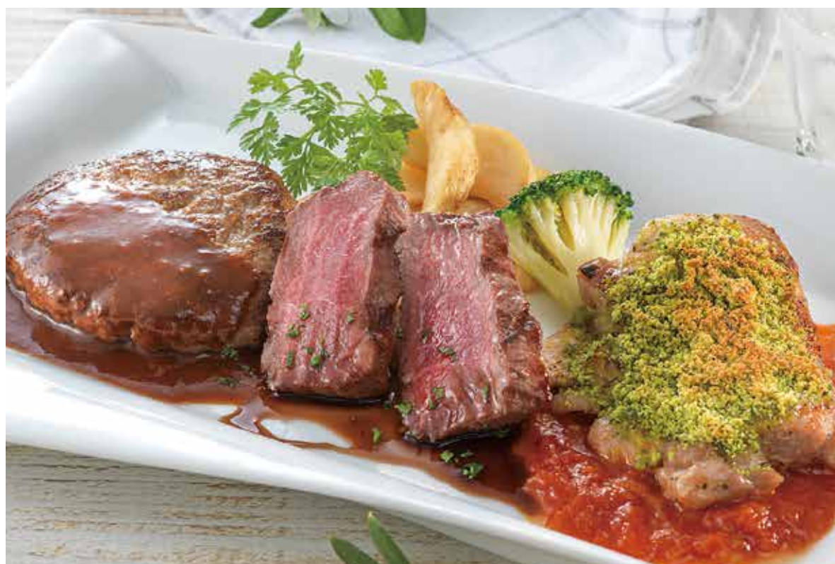
3種グリルのスペシャルアソート ————— ¥1,980 牛100%ハンバーグ、牛みすじ肉のステーキ、チキンの香草パン粉焼きを一皿で楽しめる人気メニュー。 (税込¥2,178)