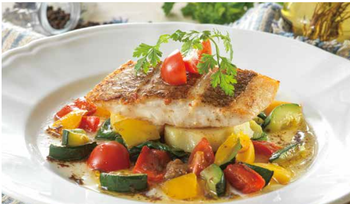
高知県産 真鯛のグリル 醤油バターソース 菜園風 ———— ￥1,790 (税込￥1,969) 醤油バターの香ばしい風味が食欲をそそる一皿。 高知県産真鯛(80g)はふっくらとした身が特徴です。