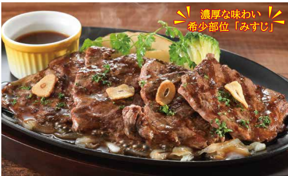
牛みすじ肉の炙り焼きステーキ ￥1,880 薄切りした US産 牛みすじ肉(160g)を (税込￥2,068) 和風ソースでお召し上がりください。