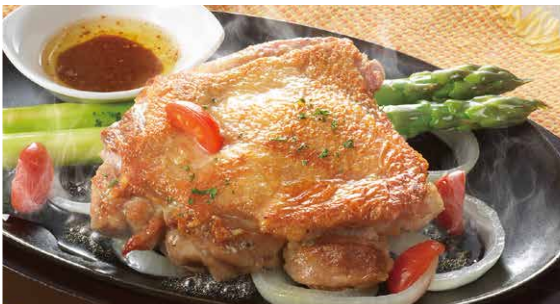
肉厚チキンステーキとアスパラガスのバター醤油ソース ￥1,680 (税込￥1,848) スパイスで仕込んだチキンを皮はパリッと！ 身はジューシーに焼き上げました。