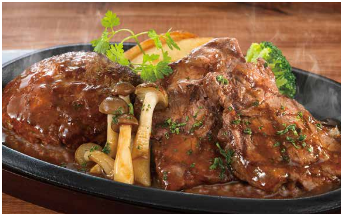
牛みすじ肉のステーキ & ハンバーグステーキ ￥1,980 牛みすじ肉のステーキ(80g)と (税込￥2,178) 牛100%ハンバーグステーキ(100g)の人気の組み合わせ。