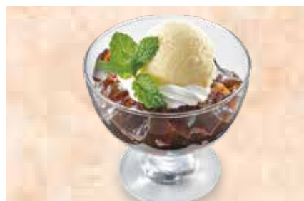
自家製コーヒーゼリー