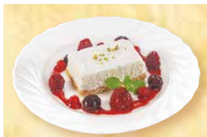
レアチーズケーキ