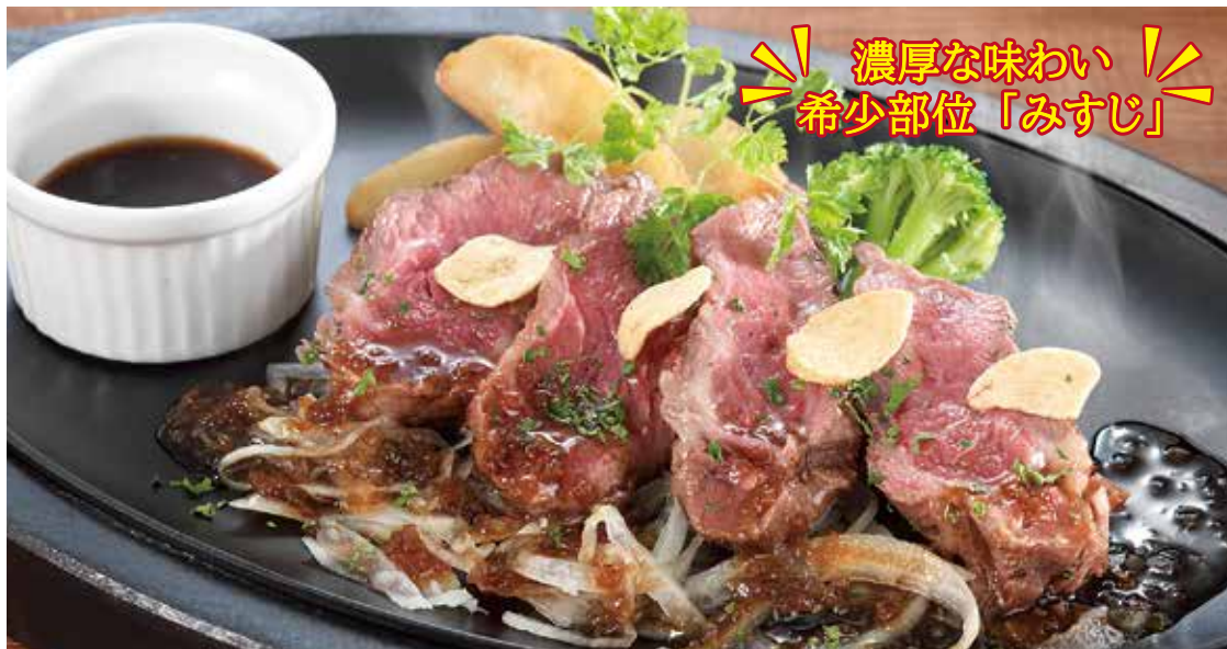
牛みすじ肉のカットステーキ ————— ¥2,250 濃厚な味わいの牛みすじ肉(120g)を和風ソースでお召し上がりください。(税込¥2,475)