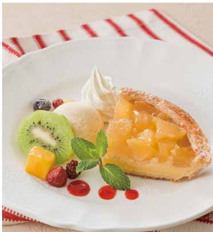
国産りんごのアップルパイ ジェラート添え

人気のアーモンドペストリーやカスタード、フルーツ、ジェラートなどを詰め込んだ満足感たっぷりのパフェ♪