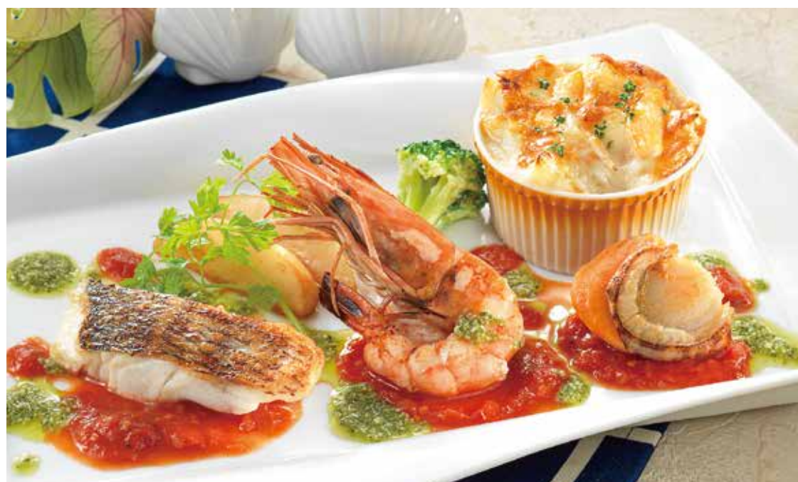
海の幸のスペシャルアソート ————— ¥2,090 (税込¥2,299) 高知県産 真鯛(40g)・有頭海老・帆立貝のグリル、紅ずわい蟹の グラタンを盛り合わせた、シーフード好きにはたまらない一皿です。