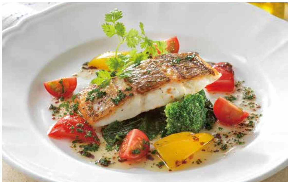
高知県産 真鯛のグリル 醤油バターソース ————— ¥1,990 (税込¥2,189) 醤油バターの香ばしい風味が食欲をそそる一皿。 ふっくらとした 真鯛をお楽しみください。