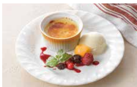
クレームブリュレのジェラート添え