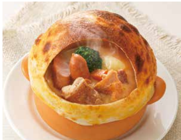
じっくり煮込んだ特製ビーフシチュー ————— ¥2,180 時間をかけて煮込みました。ほろっとお肉が美味しい！ (税込¥2,398)