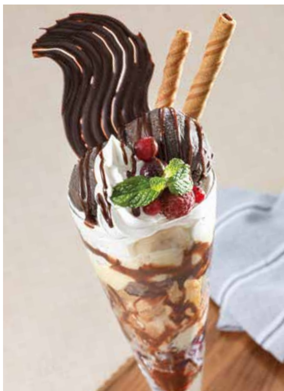
チョコレートパフェ