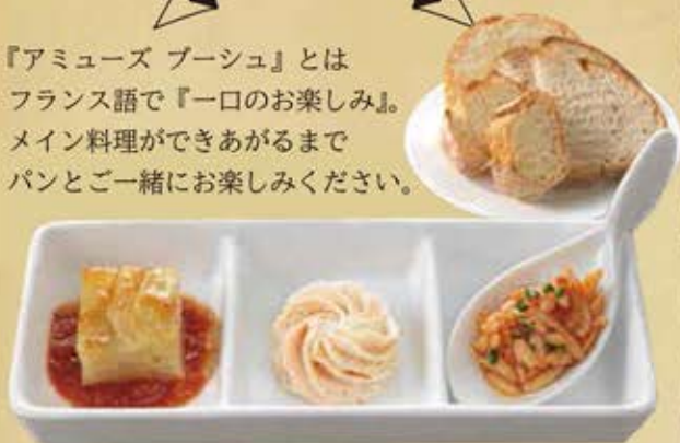
ドフィノワーズ 明太子の クリームチーズ リゾーニ トマトソース

『アミューズ プーシュ』とは フランス語で『一口のお楽しみ』。 メイン料理ができあがるまで パンと一緒にお楽しみください。