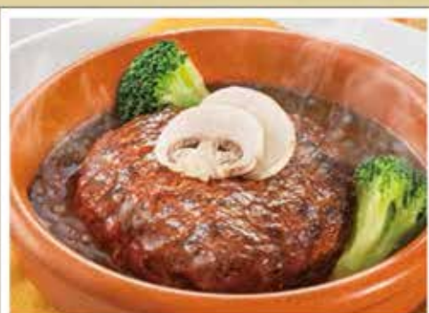
ぐつぐつ煮込んだ 牛ハンバーグステーキ シチューソース