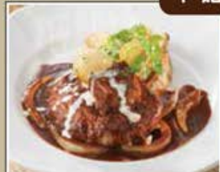
牛100%ハンバーグステーキ シチューソース