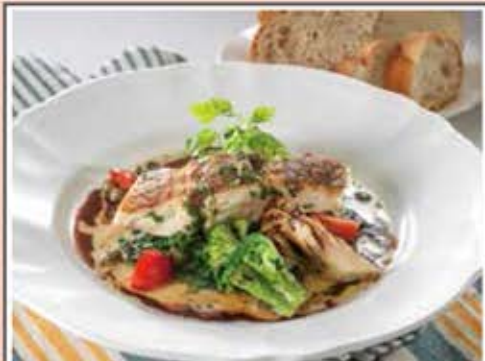
国産真鯛のグリル 焦がしバターソース