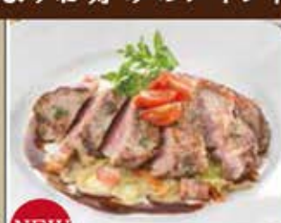
NEW ポークのグリル キャベツ プレゼ添え