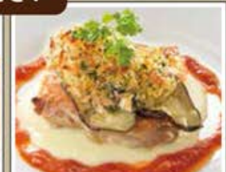
チキンのグリル ディアブロ風