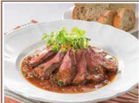
牛みすじ肉のタリアータ フォンドボー黒胡椒ソース