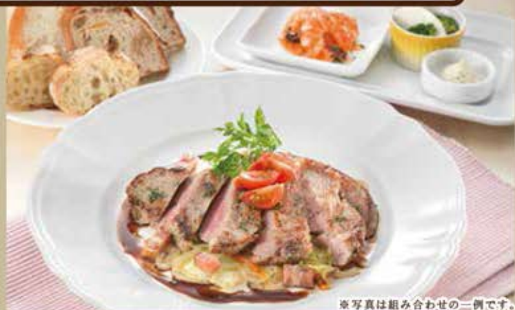
※写真は組み合わせの一例です。